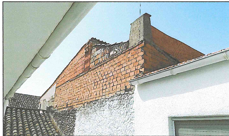
Ilustración 3. Estado actual del inmueble tras la reanudación de las obras

7. Que se continuaron las obras clandestinas que previamente se habían paralizado sin que se tenga constancia de que éstas hubieran sido objeto de una inspección ni de que se hayan realizado las pruebas necesarias que determinen la idoneidad de la estructura realizada ni la capacidad de los materiales utilizados.