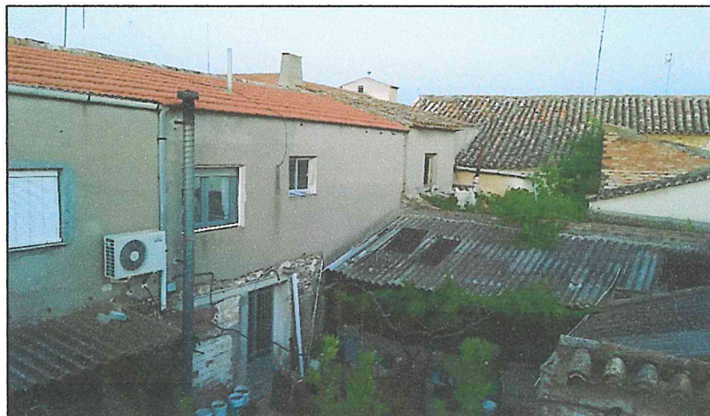
Ilustración 1. Imagen de la disposición de cubiertas antes del inicio de las obras

1. Que en el mes de octubre del año 2018 se iniciaron obras de reforma en el inmueble situado en Calle Santa Ana Nº 4, supuestamente de forma clandestina, ya que las actuaciones que llevaron a cabo (cambio en la dirección de las cubiertas, nuevos elementos estructurales, ampliación de la superficie construida,...) no habían sido objeto de proyecto ni de la correspondiente licencia municipal según nos consta.