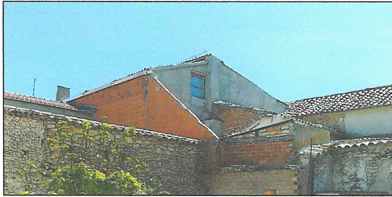
Ilustración 2. Estado del inmueble tras la paralización de las obras en marzo de 2019